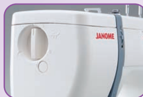
Pression du pied de biche réglable : Permet un entraînement régulier des tissus épais ou très fins et des tissus extensibles