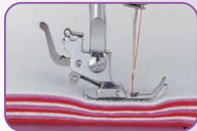
Couture dans les tissus épais grâce à la double hauteur du pied de biche et à la puissance de piquêr