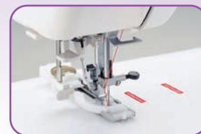
Boutonnière automatique en une phase à la taille du bouton , installez le à l'arrière du pied et réalisez une boutonnière impeccable en une seule opération