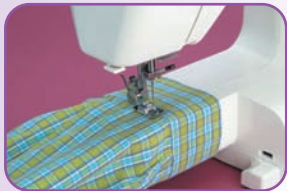
Bras libre pour les coutures circulaires (bas de pantalons manches...)