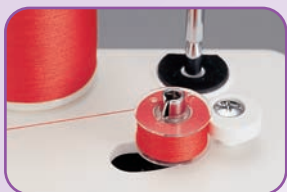
Débrayage automatique de la canette