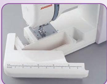
Table de couture avec les indications en inch et cm