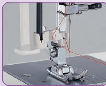
Enfilage automatique de l'aiguille