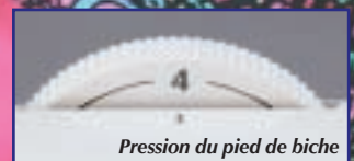
Pression du pied de biche