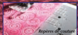
Repères de couture